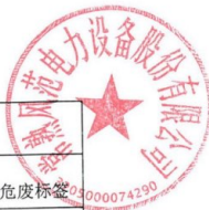
表 1 废物包装情况