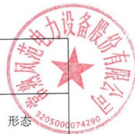
表 3 废物组分、特性